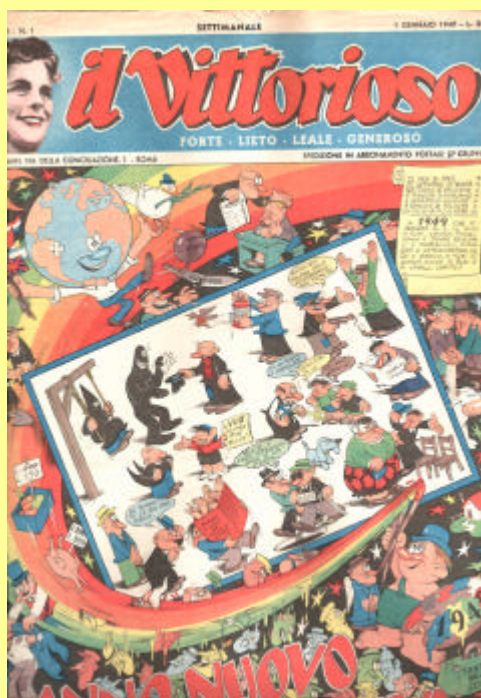
Il primo numero de il Vittorioso del 1949

Il Vittorioso ci ha insegnato a "sognare alla grande": non lasciamo che i sogni muoiano all'alba!